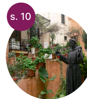
Med Frans som ledestjerne