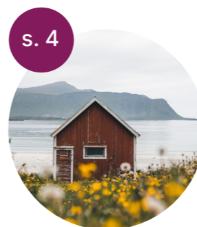
Folk flest vil dø hjemme