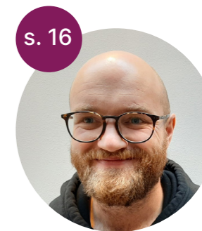
Paneldebatt om rusreformen